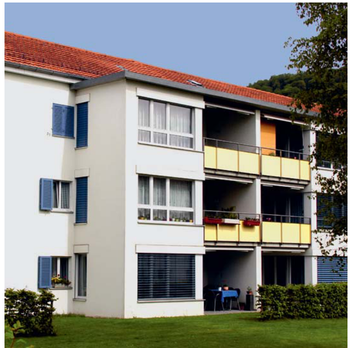
Der bestehende Balkon wurde für eine Wohnraumerweiterung genutzt und mit einem neuen, danebenliegenden Balkon erweitert.